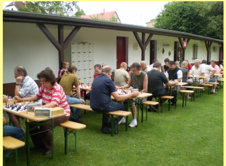
Impressionen von 2009

Anmeldung: telefonisch, per E-mail oder am Turniertag bis 10.00 Uhr